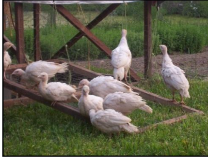
Resim 3.1: Hindi Palazı

Hindiler; civciv, palaz ve yetişkin olarak ele alınır. Hindi kümeslerinde kullanılacak atlık küflü, nemli olmamalıdır. Altlık olarak talaş, sap, kuru ot gibi nemi çeken materyaller kullanılabilir. En iyisi kalın planya talaşdır.