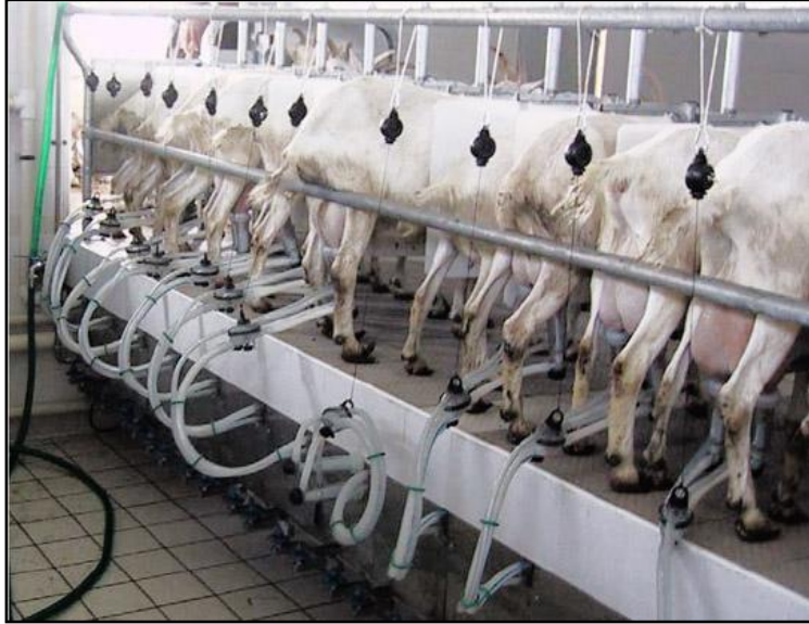
Resim 2.4: Keçilerin otomatik saėım odası

Saėım yeri olarak ağıl içindeki bölmelerden biri kullanılabilceėi gibi ayrı saėım yeri de yapılabilir. Saėım elle yapılabildiėi gibi makineli saėım daha uygundur. Süt koyunculduğunda iřgücünün önemli bir kısmı saėım için gereklidir.