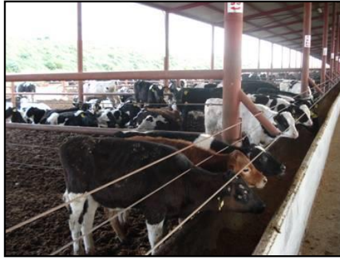
Resim1.2: Sığır yemliđi

Yemlikler 50-70 cm genişlikte, 20 cm yükseklikte yapılmalıdır. Yemliklerin ön kenar yüksekliği 50 cm, kalınlığı 10-12 cm civarında olmalıdır. Yemliklerde kolaylıkla temizlenebilen ve aşınmaya karşı dirençli malzeme kullanılmalıdır. En uygun yemlik, betondan yapılandır.