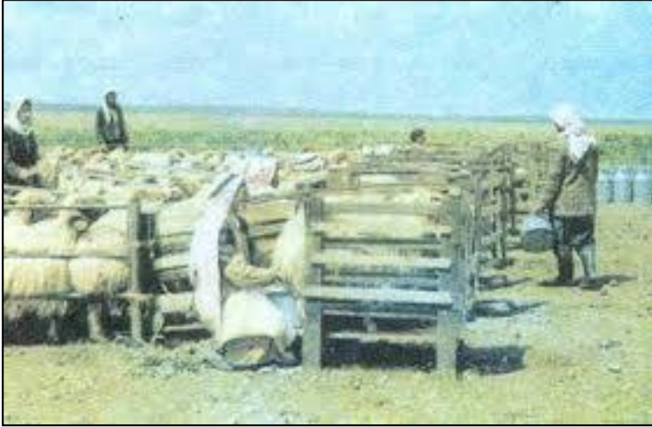
Resim 2.5: Merada koyunların elle sağılma yeri

El ile yapılan sağımlarda iki sağıcıya bir tutucu gerekir. Sağım için işgücü ihtiyacını azaltmak, temiz ve kokusuz süt elde etmek amacıyla sabit ve taşınabilir sağım yerleri yapılabilir. “Kotra” adı da verilen bu tip sağım duraklarında çitlerin yüksekliği 100-105 cm olabilir. Sağım direğinin ön genişliği 30-35 cm arka genişliği ise 50-55 cm olmalıdır.