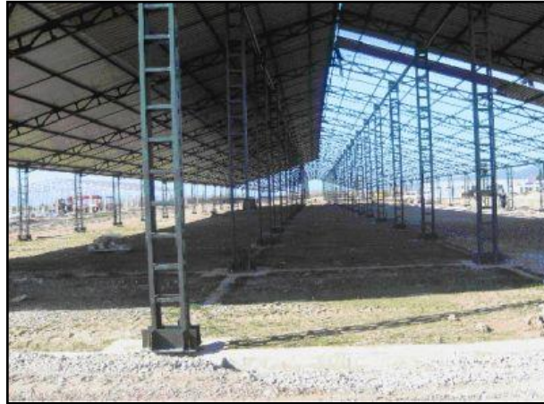
Resim 1.10: Ahır çatı sistemi

Ahırların tabandan saçaklara kadar yüksekliği, tesisin bulunduğu bölgenin iklimi ve ahırdaki hayvan miktarına göre değişmekle birlikte 3-3,5 metre arasında olmalıdır. Çatı, içerinin sıcaklığını dışarıya, dışarının soğukunu içeriye geçirmemelidir. Yağmur suları içeriye akmamalıdır. Doğal havalandırmayı sağlamak için 22-25°lik bir çatı eğimi olmalıdır. Ahırın tavan veya çatısının naylon, ziftli bez gibi gaz geçirmeyen maddelerden kaplanması, kiremit altına bu maddelerden döşenmesi havalandırma açısından çok sakıncalıdır.