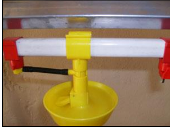
Resim 3.4: Otomatik suluk