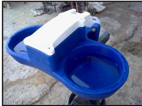
Resim 2.3: Otomatik suluk

Yalak tipi suluklar galvanizli sac ya da betondan yapılabilir. Bu tip suluklarda şamandıra kullanılabilir. Tabandan olan yüksekliği 40 cm olmalıdır. Her 10 koyuna 30-35 cm suluk uzunluğu düşünülmelidir. Otomatik suluklarda ise 25-40 koyuna bir otomatik suluk hesaplanmalıdır. Damla suluklar fazlaca kullanım alanı bulamamıştır.