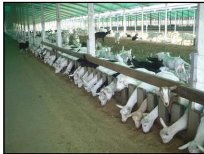
Resim 2.1: Keçi ağılı