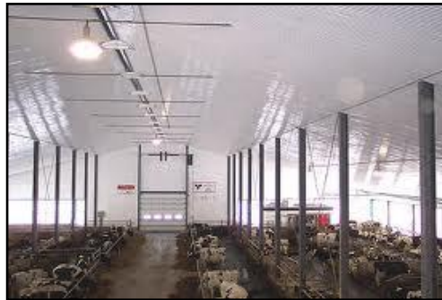
Resim 1.9: Serbest duraklı ahır

Bu ahırlar daha da geliřtirilerek dıř hava ortamının ahır iinde oluřturulduęu soęuk ahır tipine dnřtrlmřtr. Bu ahırlar, geliřmiř lkelerde son yıllarda tercih edilen rakipsiz ahır Őeklidir. Serbest-duraklı ahır, lkemizin her tarafında uygulanabilir. Ancak srdeki inek sayısının 20'nin zerinde olması gerekmektedir.