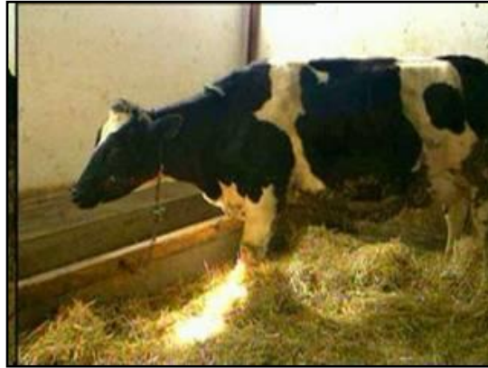
Resim 1.5: Dođum blmesi

St sıđırı ahırlarında sađmal hayvan blmesi, kısır hayvan blmesi, dana blmesi, buzađı blmesi, dođum blmesi, sađım makine ve malzemeleri blmesi, bakıcı blmesi ve yem depoları olmalıdır.