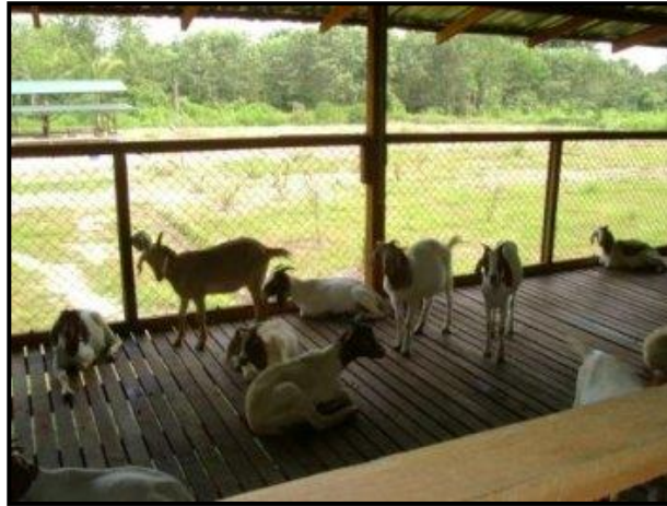
Resim2.2: Tel ızgaralı ağıl

Izgaralar, ahşap, metal ya da betondan yapılabilir. Ahşap ızgara boyutları (çita kesitleri) 4x5 cm, 5x5 cm ve 6x5 cm şeklindedir. İki çita arası aralık 1,5-2 cm şeklindedir. Kesitleri verilen bu ızgaralar 10x5 cm'lik kalaslar üzerine çakılmalıdır.