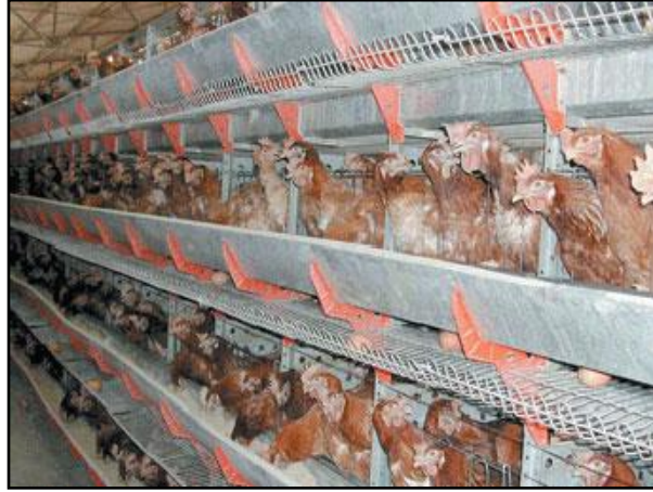
Resim 3.2: Folluk

Folluklar gerekli şekilde ve sayıda hazırlanırsa kırık ve kirli yumurta miktarı önemli bir ölçüde azalma gösterir. Bu nedenle folluklar, tavukların tünemelerini ve geceleri içinde yatmalarını önleyici bir şekilde düzenlenmelidir. Folluklardaki genişlik, derinlik ve yükseklik ölçüleri 30-35 cm boyutlarında olmalıdır. İki-üç katlı, kapanlı ve grup follukları olmak üzere değişik şekillerde folluklar kullanılabilir. Basit folluklar 6 tavuğa 1 adet, kapanlı folluklar ise 4 tavuğa 1 adet olarak hesaplanır. Folluklar, piliçler yumurtaya girmeden en az 15 gün önce duvar kenarları gibi loş yerlere yerleştirilmelidir.