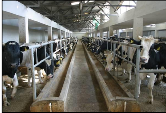
Resim 1.6: Bağlı duraklı ahır

Bağlı duraklı ahırların istenilen biçimde kullanılabilmesi için ahır tabanını oluşturan bütün elemanların uygun biçimde düzenlenmesi gerekir. Ahır tabanı; yemlik yolu, yemlik, durak, idrar kanalı ve servis yolu olmak üzere 5 bölümden oluşur