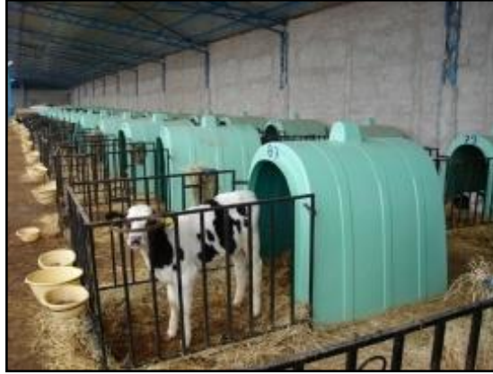
Resim 1.4: Buzađı blmesi

St sıđırı ahırlarında sađmal hayvan blmesi, kısır hayvan blmesi, dana blmesi, buzađı blmesi, dođum blmesi, sađım makine ve malzemeleri blmesi, bakıcı blmesi ve yem depoları olmalıdır.