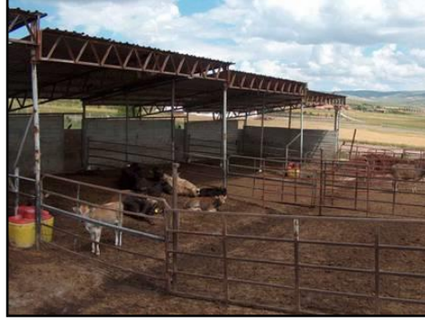
Resim 1.8: Padok