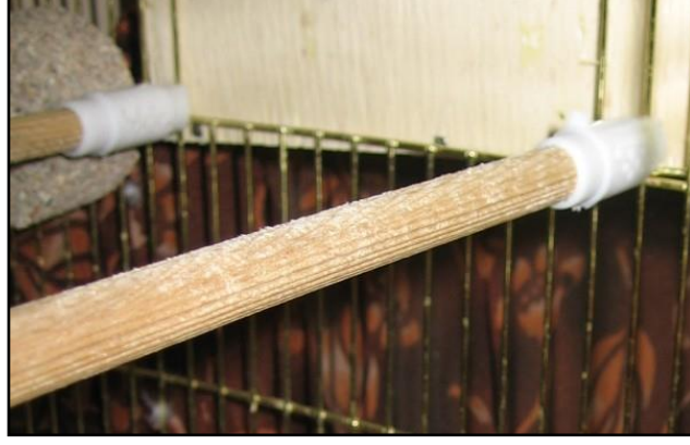
Resim 3.3: Tünek