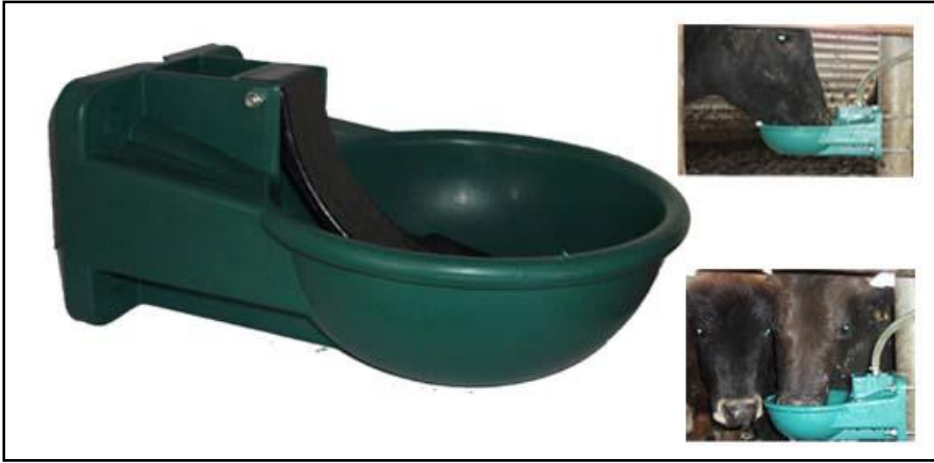
Resim 1.3: Otomatik suluk

Mevcut besi işletmelerinin küçük bir bölümü otomatik veya yarı otomatik suluklar kullanır. Geri kalanların çok büyük bir bölümü de suyu belirli öğünlerde yemlikten verme yolunu seçer. Yemlikten su ihtiyacının giderilmesini sağlayan bu uygulama, iş gücü ihtiyacını arttırır ve yem tüketiminin sürekliliğini engeller. Türkiye’de yaygın olan kapalı-bağlı ahırlarda uygulama çoğunlukla bu şekildedir. Bu tip ahırların yeniden düzenlenmesi gerekir. Bunların serbest hâle dönüştürülmesiyle işgücü azalacak, aynı alanda hayvan beslenebilecek ve hayvanların istediklerine daha kolay ulaşması sağlanacaktır.