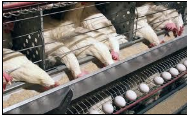
Resim 3.5: Kafes tipi tavuk yemliđi

Yemin en ekonomik bir şekilde tüketilmesini sağlayan faktörlerden biri de yemliklerin dökülme kayıplarını önleyecek biçimde yapılmış olmasıdır. Bunun yanı sıra yemliklerin 2/3 oranından daha fazla dolu olması, yem kaybını artıran bir faktördür.