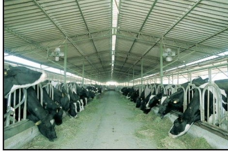
Resim1.1: Servis yolu

Ahır temizliği, altlık malzemenin serilmesi, hayvanların duraklara giriş ve çıkışları amacıyla kullanılan bölümdür. Servis yolu genişliği, ahır içi düzenleme biçimi, gübre temizlemede traktör ya da diğer mekanik araç kullanımı, sürü büyüklüğü gibi özelliklere bağlı olarak tek sıralı ahırlarda 120-150 cm, iki sıralı ahırlarda 150-250 cm arasında olabilir.